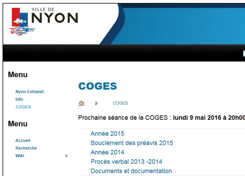
Fig. 2 : capture d'écran extranet

L'extranet utilisé actuellement par la Commission de Gestion ( https://extranet.nyon.ch ) peut également être utilisé pour les commissions permanentes qui le souhaitent. Il est surtout utile s'il faut gérer des informations de type texte en plus d'un dépôt de documents, ou garder les documents sur une longue durée.