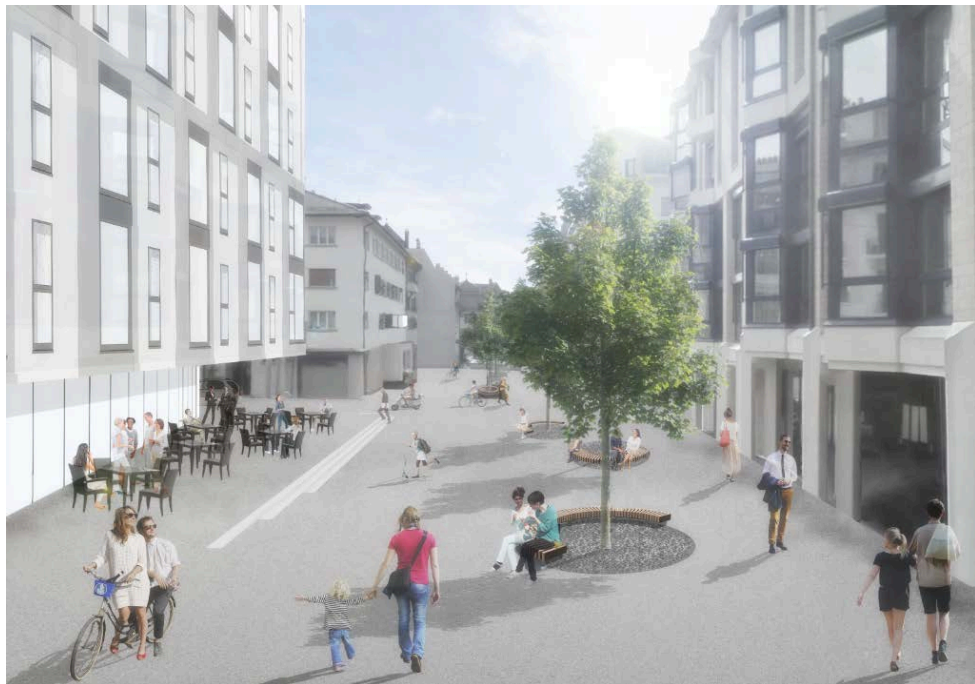
Vue de la rue Jules-Gachet en direction de la rue Perdtemps

L'éclairage public sera entièrement revu en fonction des nouveaux aménagements projetés. Une étude photométrique sera menée afin de réaliser un concept intégré à l'échelle de la rue, tout en garantissant la sécurité et le confort des usagers dans ce nouvel espace public.