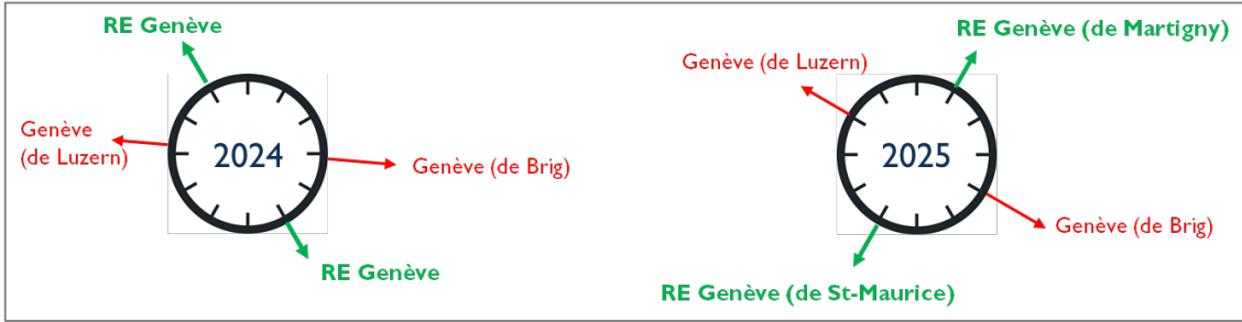
Figure 2 – départs 2024 et 2025 en direction de Genève