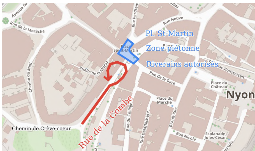
Figure 2 Plan d'accès à la rue de la Combe

Par ailleurs, la rue de la Combe compte aujourd'hui, sept places de stationnement pour les véhicules individuels motorisés et huit places motos.