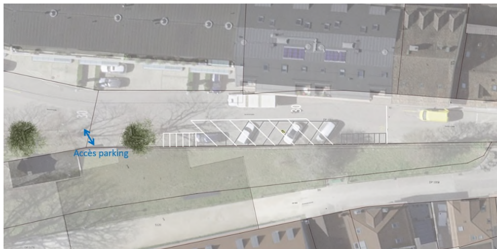
Figure 4 Modification du sens de stationnement rue de la Combe

Le réaménagement proposé consiste à redisposer les places de stationnement afin de faciliter le stationnement des visiteurs du centre-ville en provenance du chemin de Crève-Cœur selon la figure 4