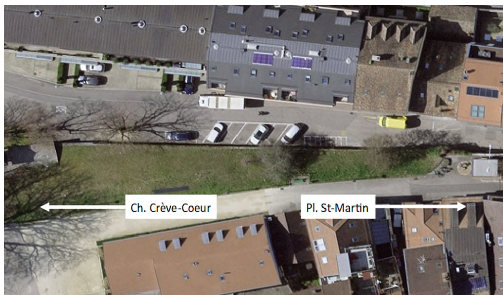
Figure 3 Stationnement rue de la Combe

Par ailleurs, la rue de la Combe compte aujourd'hui, sept places de stationnement pour les véhicules individuels motorisés et huit places motos.