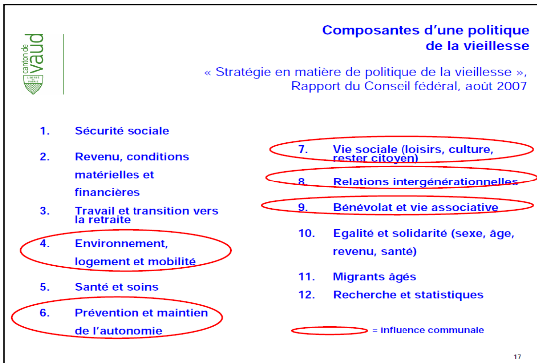
Composantes d'une politique de la vieillesse à l'échelle communale

Les composantes d'une politique de la vieillesse ont été énumérées par la Confédération et adaptées à l'échelle des communes. Le Service des assurances sociales et de l'hébergement (SASH) du Canton de Vaud en a proposé la lecture suivante :