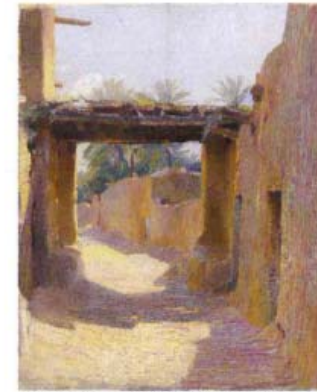
Rue de village au Maghreb, vers 1895. FAH