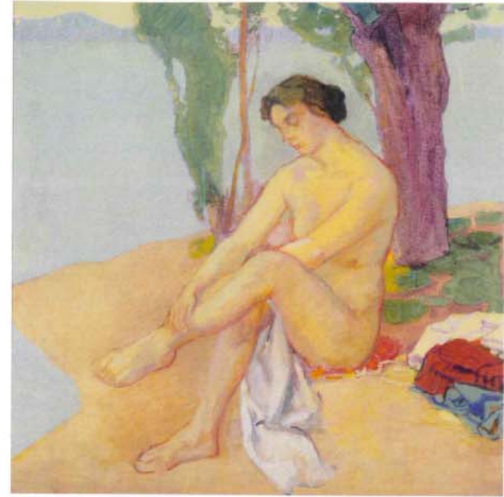
Baigneuse au bord de l'eau s'essuyant, vers 1915, FAH