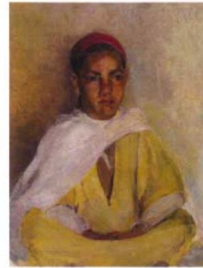
Jeune arabe assis, vers 1890. FAH