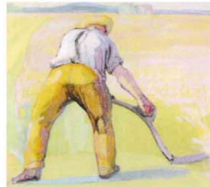
Faucheur de dos, vers 1915.