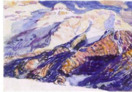
Montagnes enneigées, vers 1910. FAH