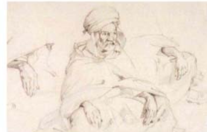
Vieil arabe assis et étude de mains, vers 1890. FAH