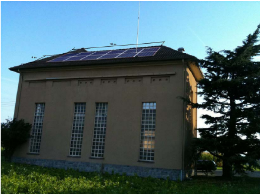
Toiture Sud-Ouest surface panneaux ~51 m 2 puissance 7.5 kWpc