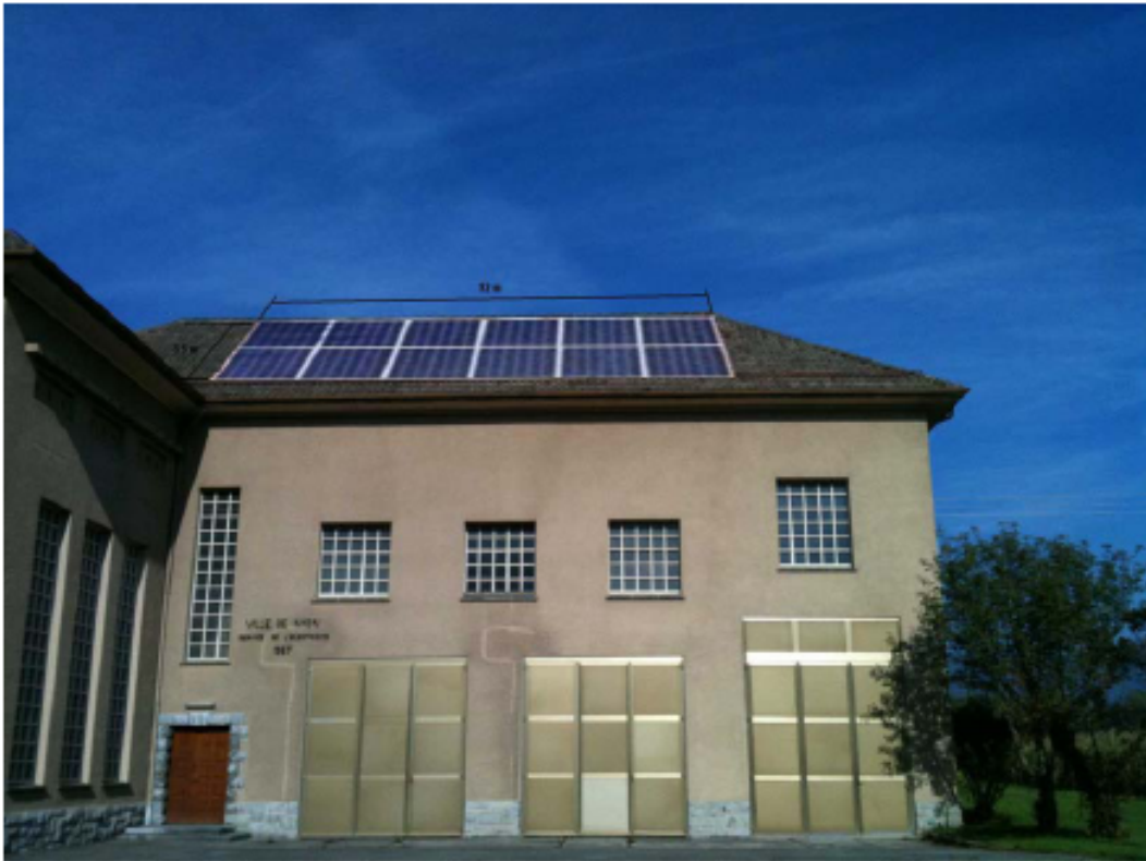
Toiture Sud-Est surface panneaux ~67 m 2 – puissance 10 kWpc