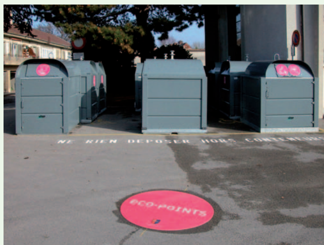
Eco-point de Perdtemps

Egalement sur Internet des sites ( www.betteruse.org ) qui proposent gratuitement de donner et échanger des biens.