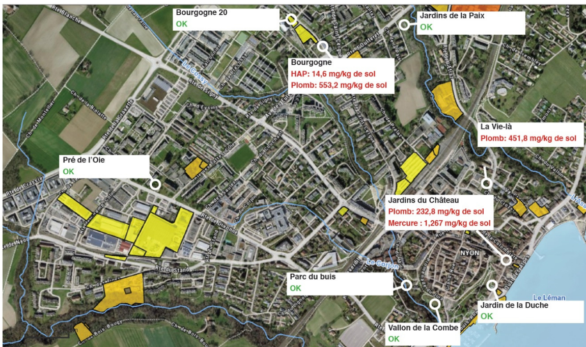
Figure 1 : Résultats des analyses de sol des potagers de Nyon (seuils d'investigation dépassés en rouge)

D'un point de vue sémantique et pour la bonne compréhension du propos, un « jardin potager » est composé de plusieurs « parcelles de potagers », elles-mêmes louées à des jardinier-ère-s.