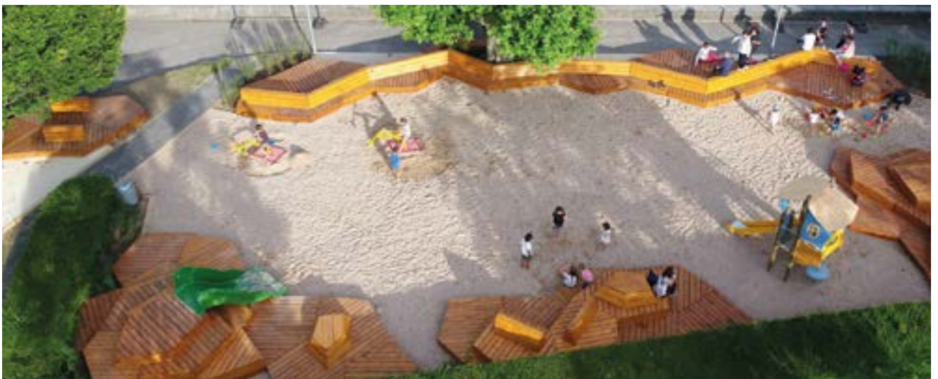
Photos du square Perdtemps, réalisé en 2017, par Belandscape